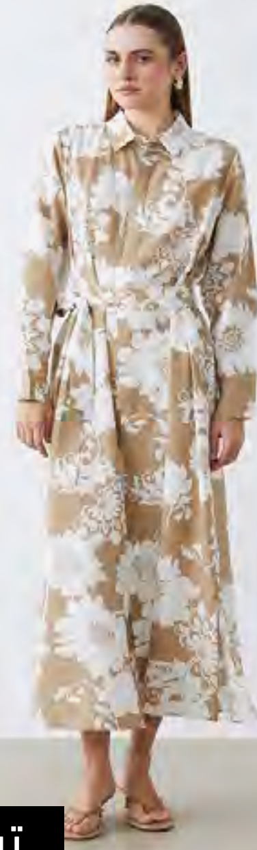
فستان قميص كم طويل بطبعة AED 109