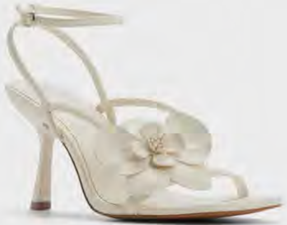
كاليا صندل كعب بحزام كاحل AED 299