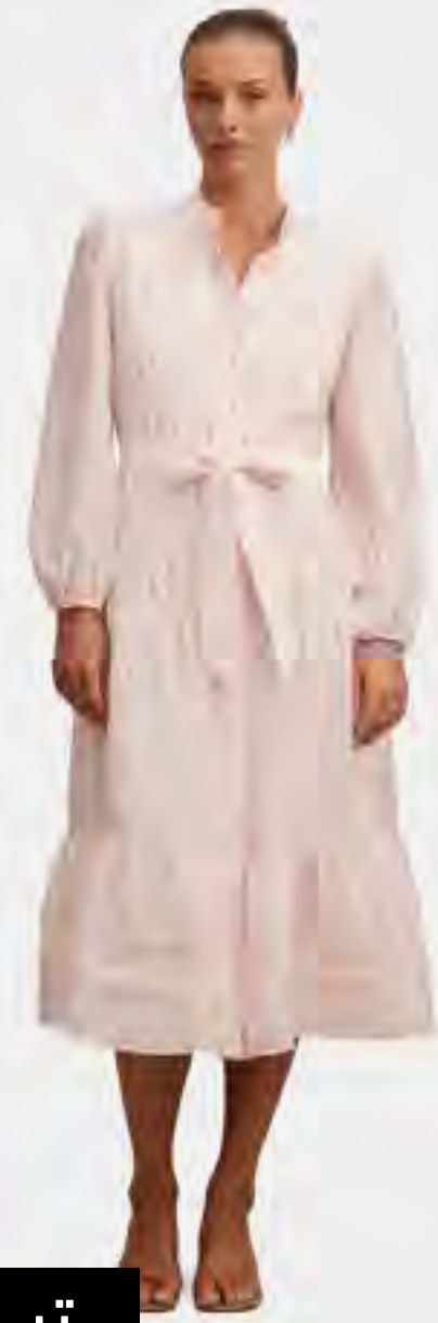
فستان ريتشل ميدي بطبعة AED 589