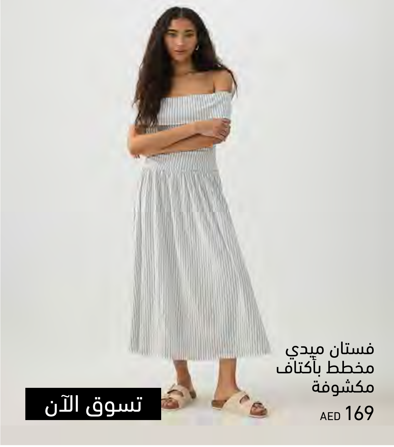
فستان ميدي مخطط بأكتاف مكشوفة AED 169