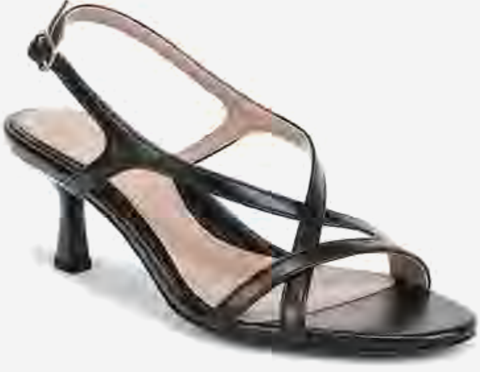
صندل كعب ترو لي بسيور أنيقة AED 499