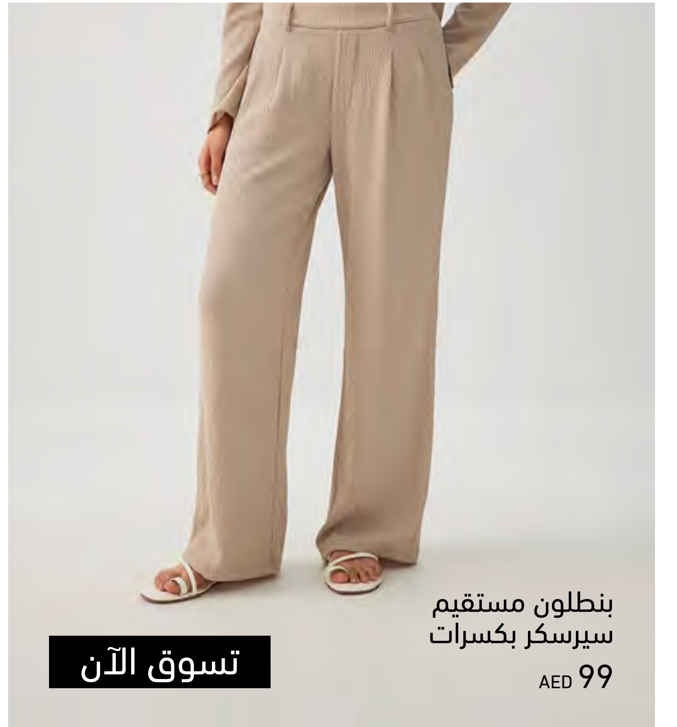
بنطلون مستقيم سيرسكر بكسرات AED 99