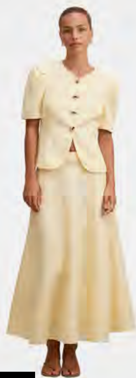
توب تامارا بأكمام قصيرة AED 259