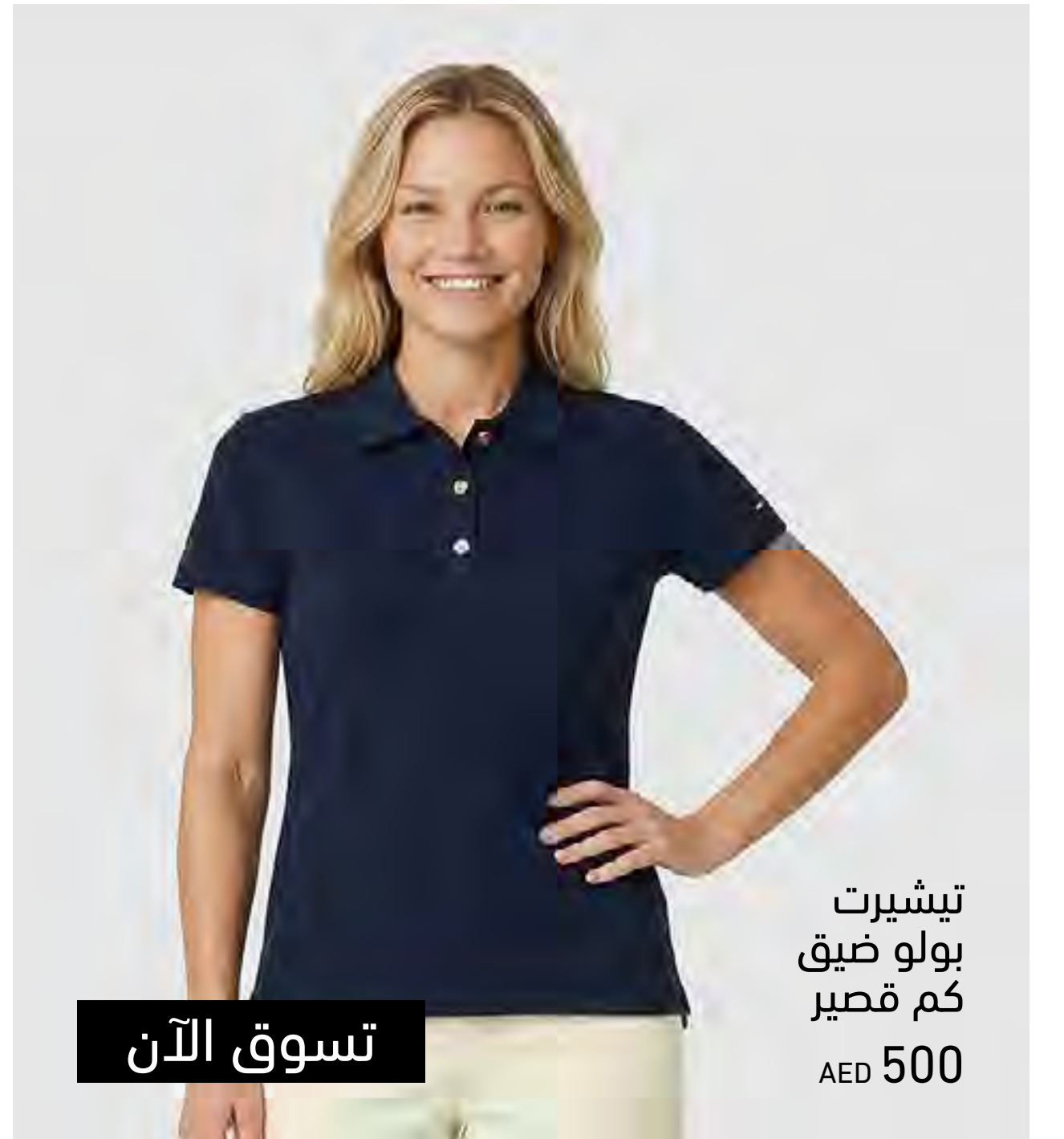
تيشيرت بولو ضيق كم قصير AED 500