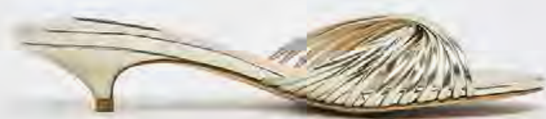
صندل كعب كيتين مفتوح من الأمام AED 389