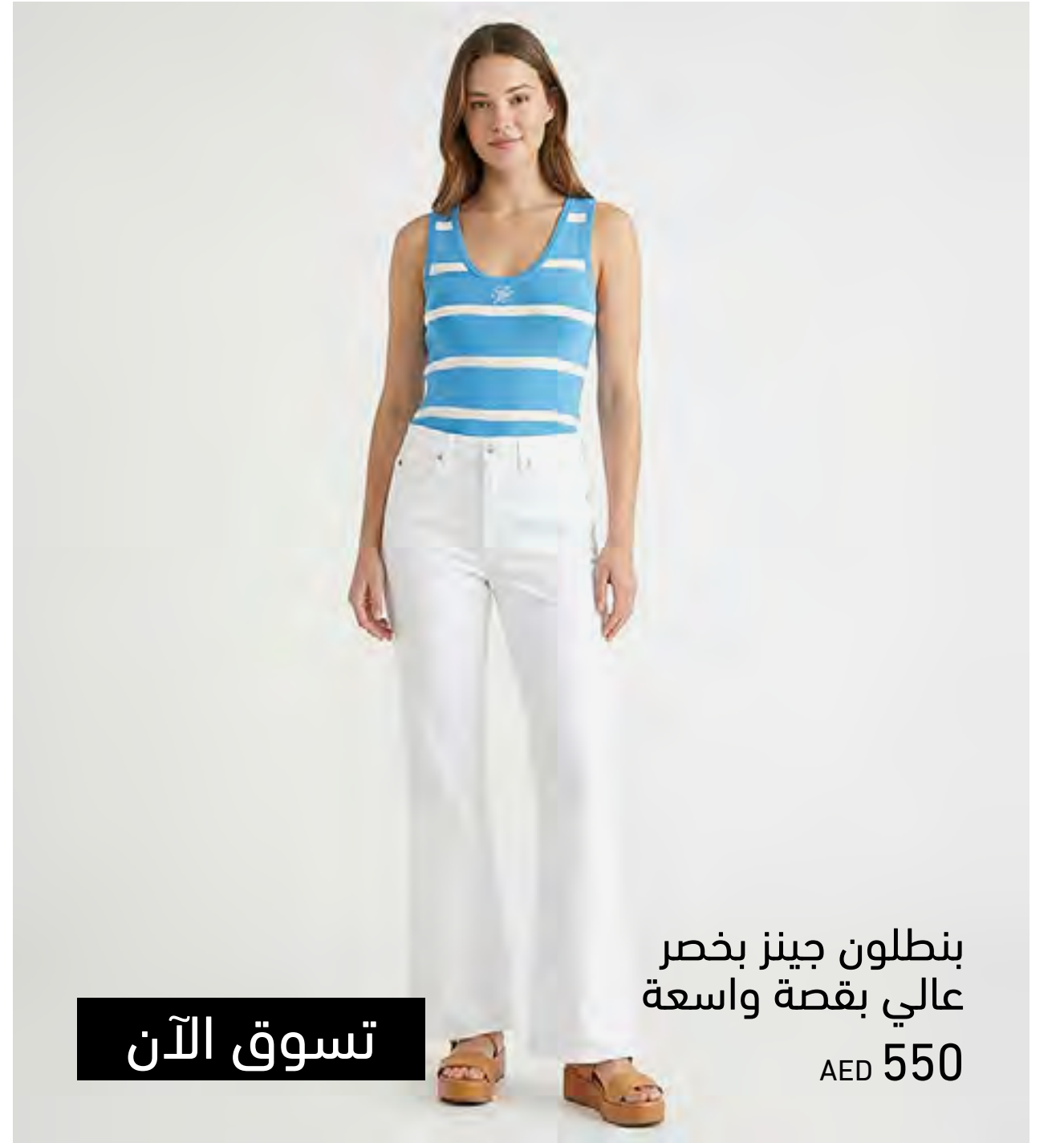
بنطلون جينز بخصر عالي بقصة واسعة AED 550