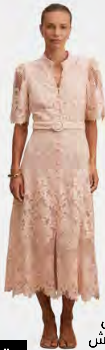
فستان ميدي دانتيل ليبرتي بأكمام كشكش AED 759