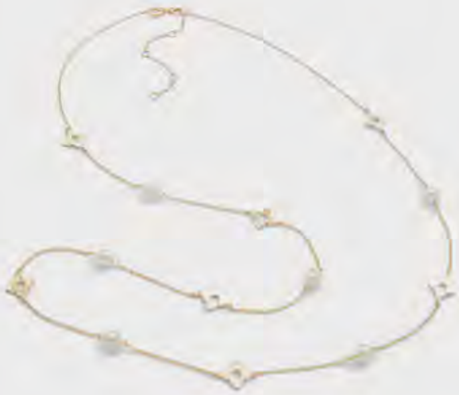
إليدندرا عقد مزين بتفاصيل مرصعة