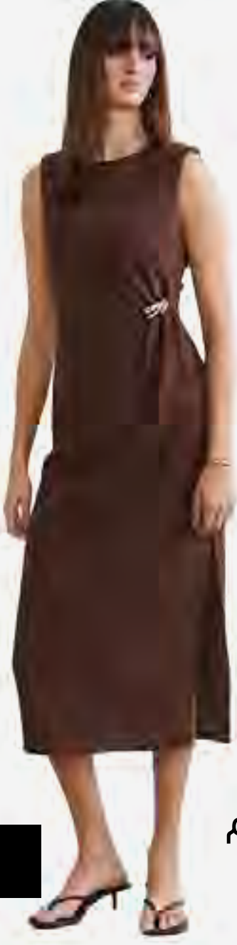
فستان ميدي منسوج بدون أكمام AED 129