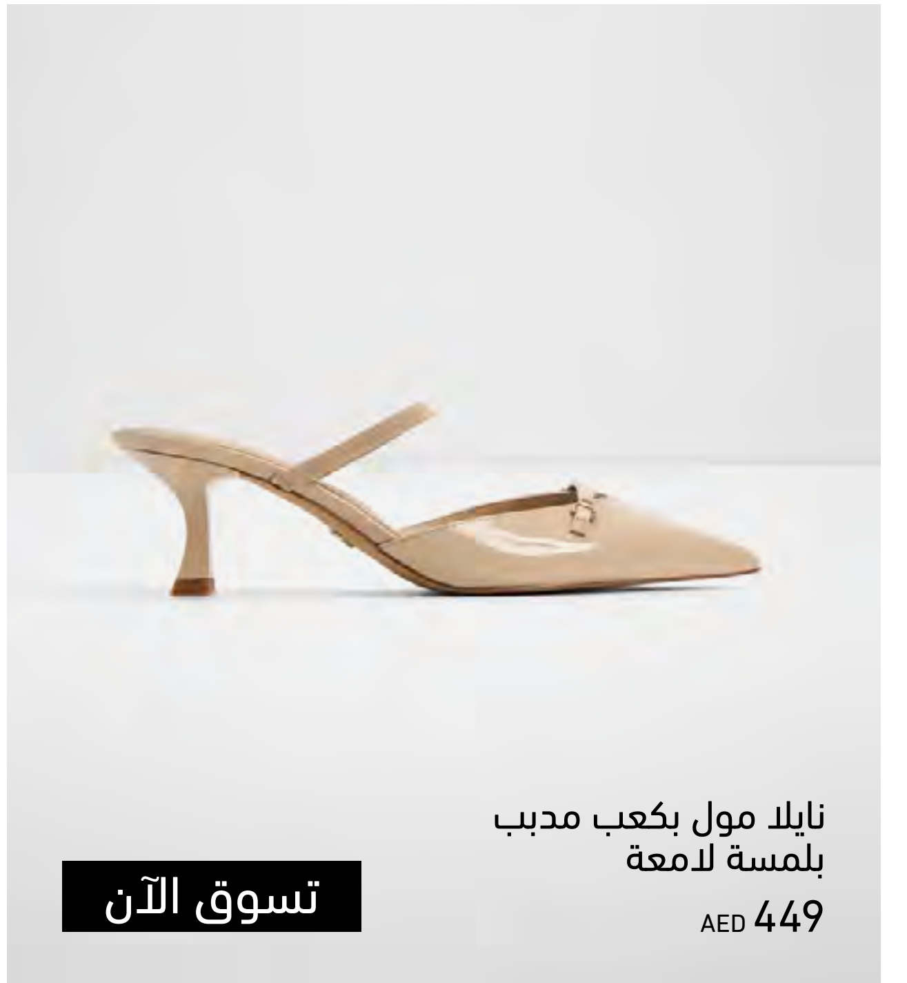
نايلا مول بكعب مدبب بلمسة لامعة AED 449