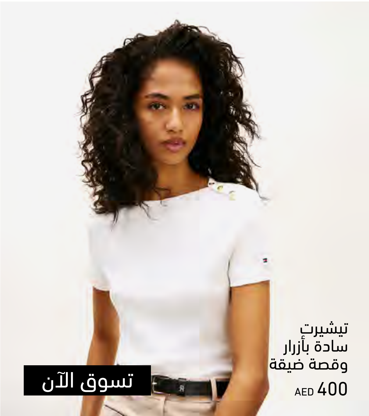
تيشيرت سادة بأزرار وقصة ضيقة AED 400