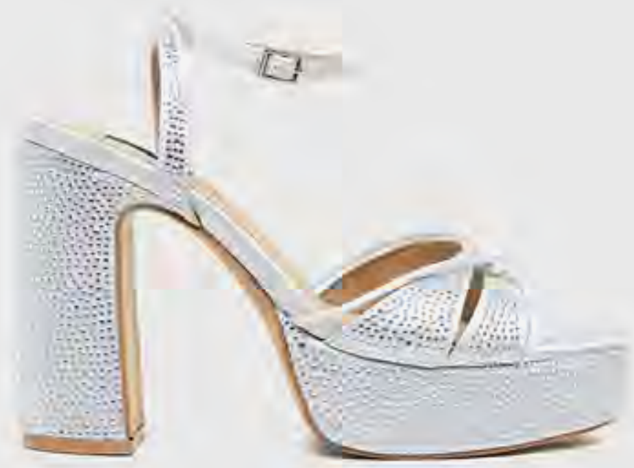
صندل بكعب عريض وحزام كامل AED 399