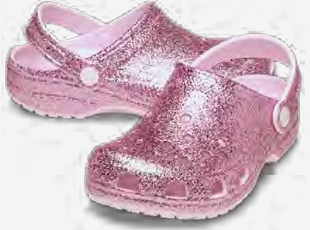
كلوغ تشانكي كلاسيكي لامع AED 279