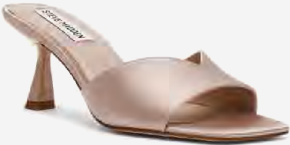
صندل كعب آيفي مفتوح من الأمام AED 349