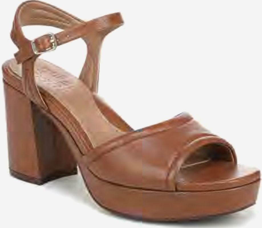
صندل كعب بلا تفورم بيترا بحزام كاحل AED 549