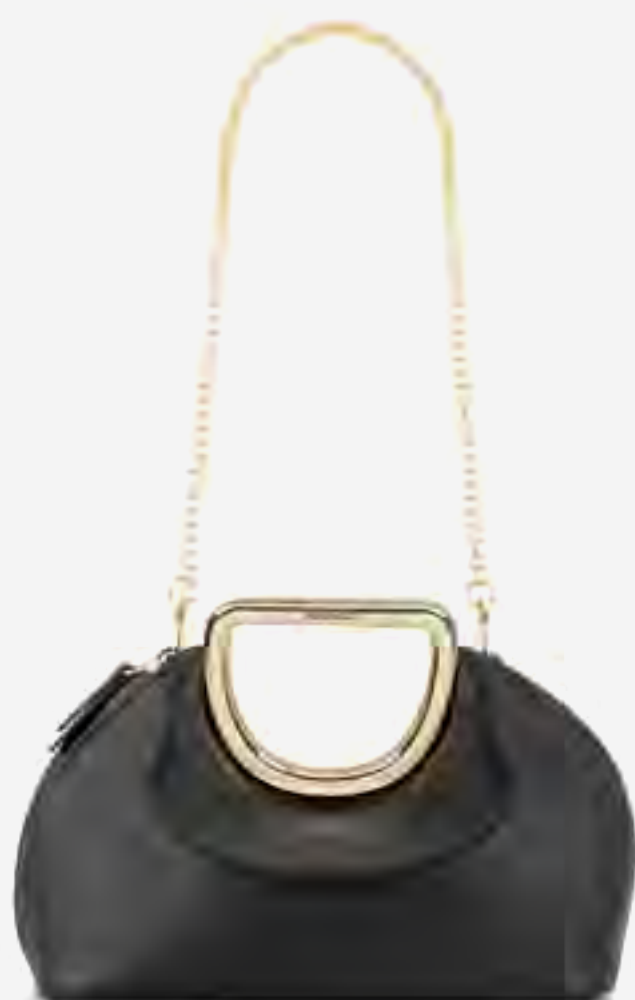
شنطة كلتش بملمس نسيجي مع حزام طويل AED 379