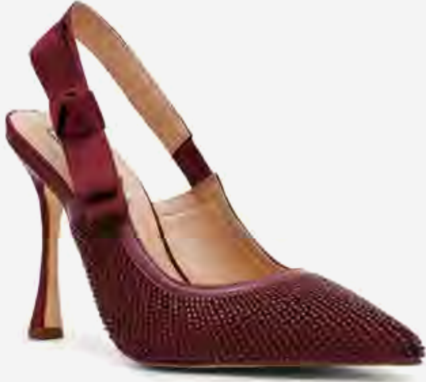
حذاء كعب بريلي بسير خلفي مرصع AED 549