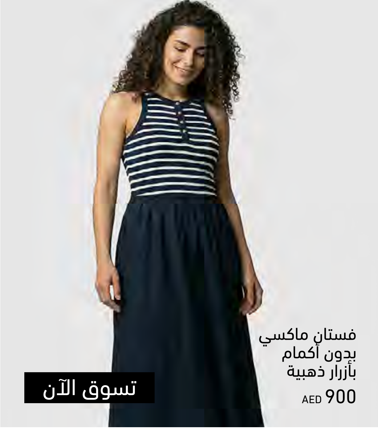
فستان ماكسي بدون أكمام بأزرار ذهبية AED 900