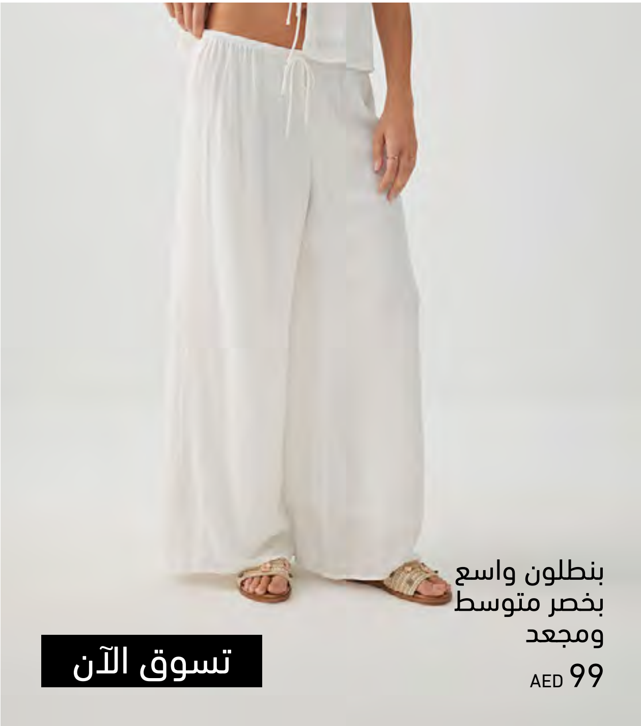
بنطلون واسع بخصر متوسط ومجعد AED 99