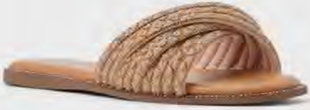
فيرونا صندل مسطح بسيور مرصعة AED 279