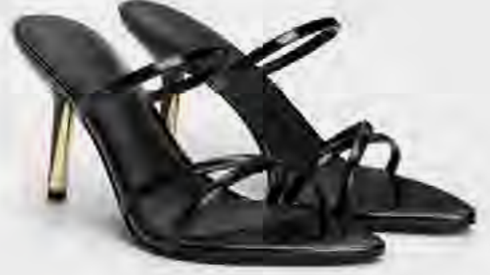
حذاء مول بكعب بسبور أنيقة AED 375