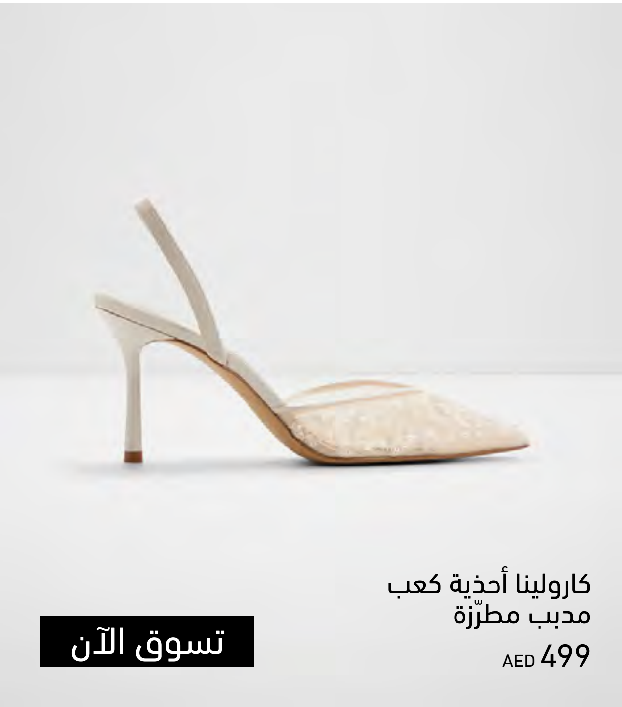
كارولينا أحذية كعب مدبب مطرزة AED 499