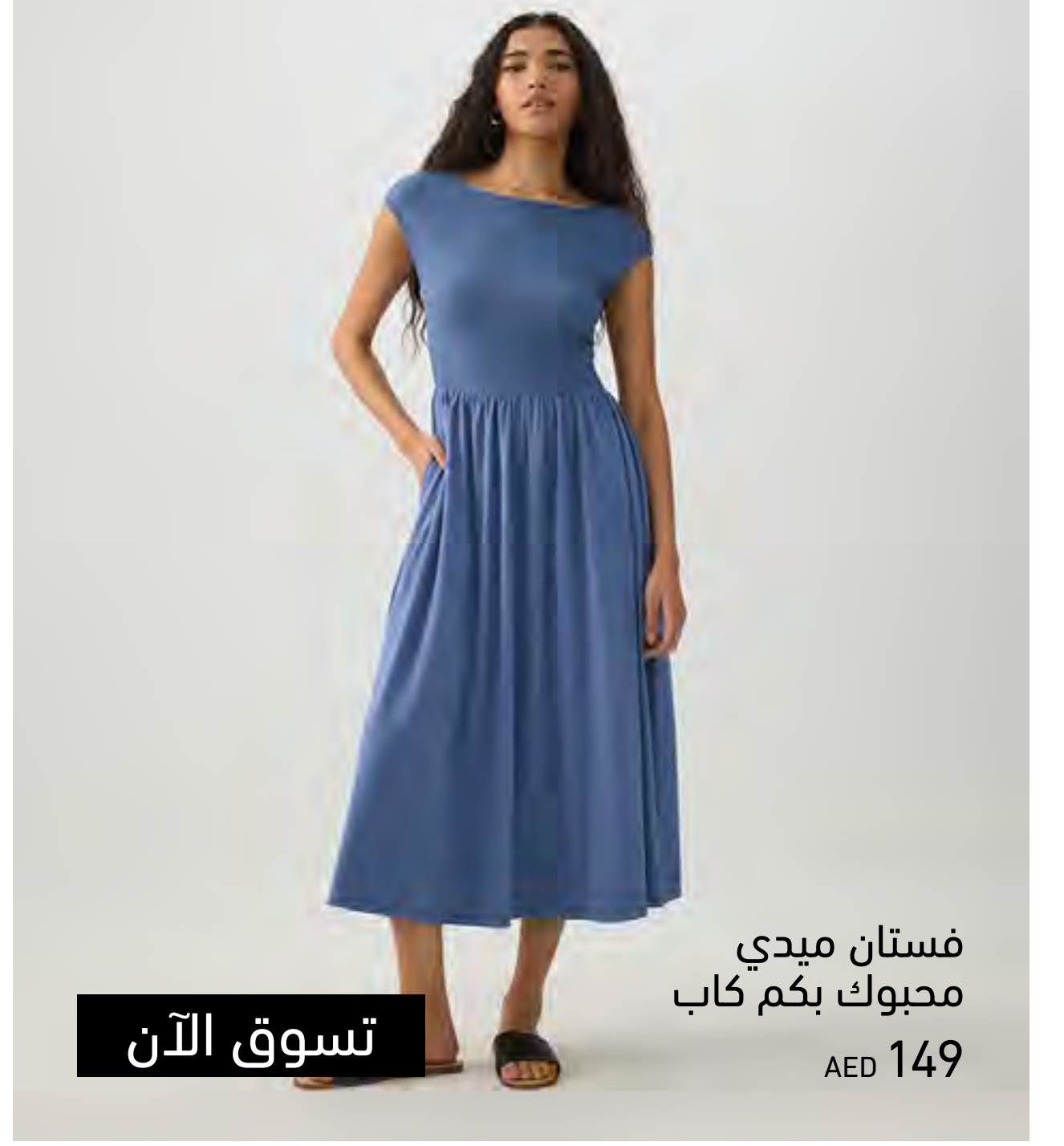
فستان ميدي محبوك بكم كاب AED 149