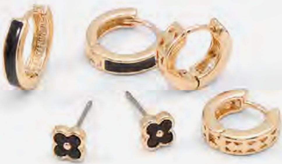
سيرافا طقم أقراط مزينة (3 قطع)