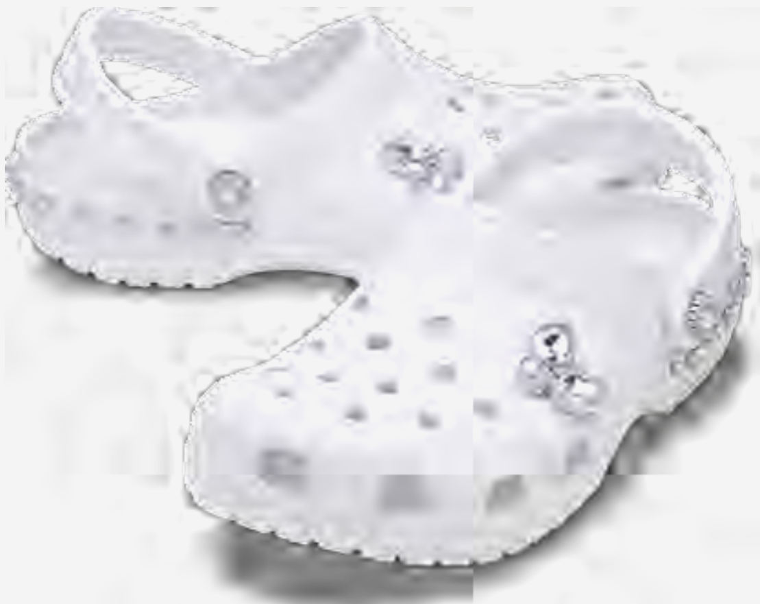
كلوغ كلاسيك بيناكل AED 349