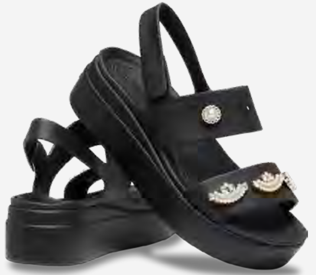
صندل بروكلين بيناكل مزين 4 يو AED 329