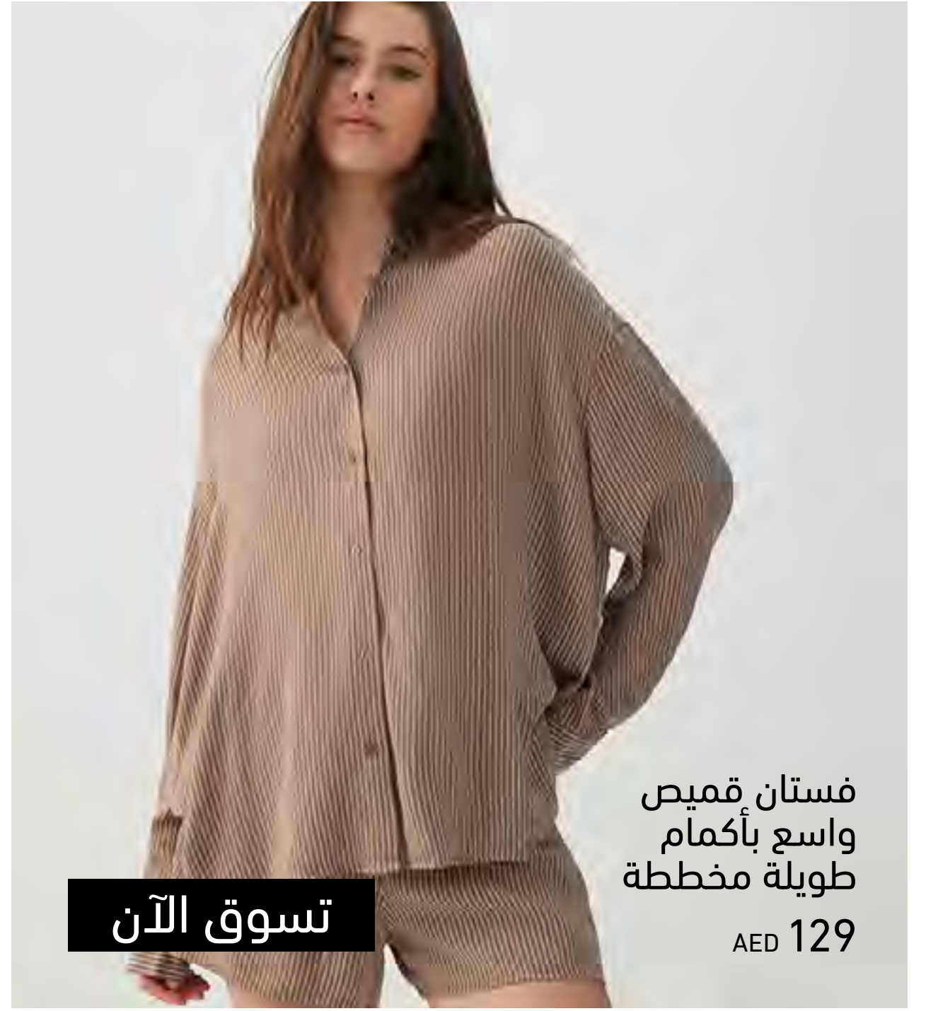
فستان قميص واسع بأكمام طويلة مخططة AED 129