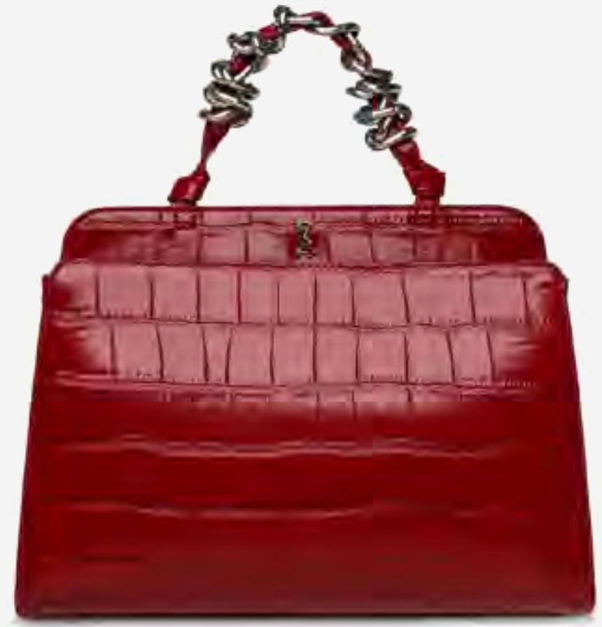
شنطة ساتشل بلون بلمس نسيجي AED 399