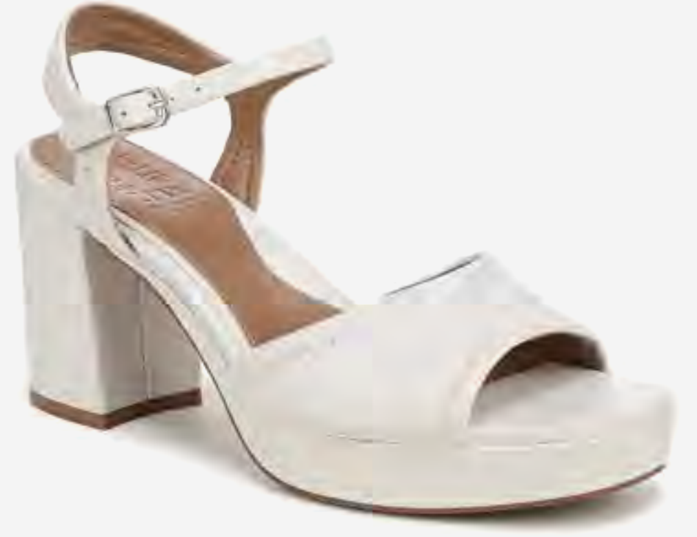
صندل كعب بلا تفورم بيترا بحزام كاحل AED 549