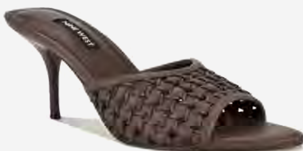
صندل كعب كيريللا 3 مفتوح من الأمام AED 379