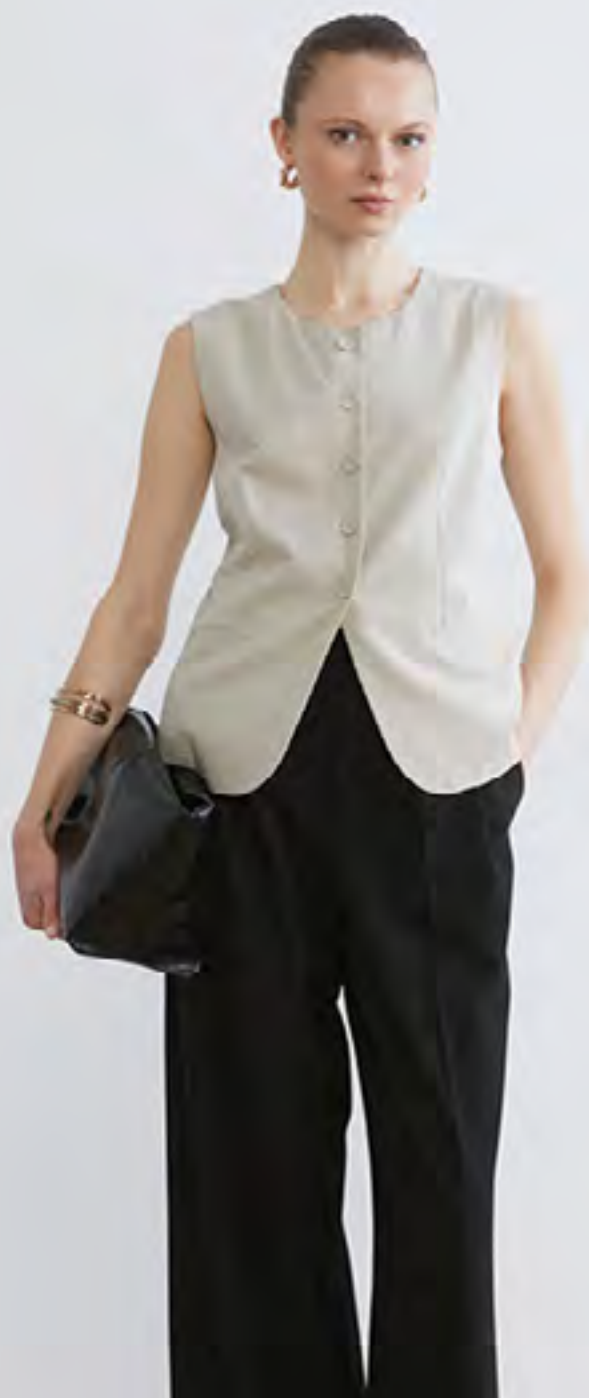
فيست شبه لينن سادة بقبة مستديرة AED 119