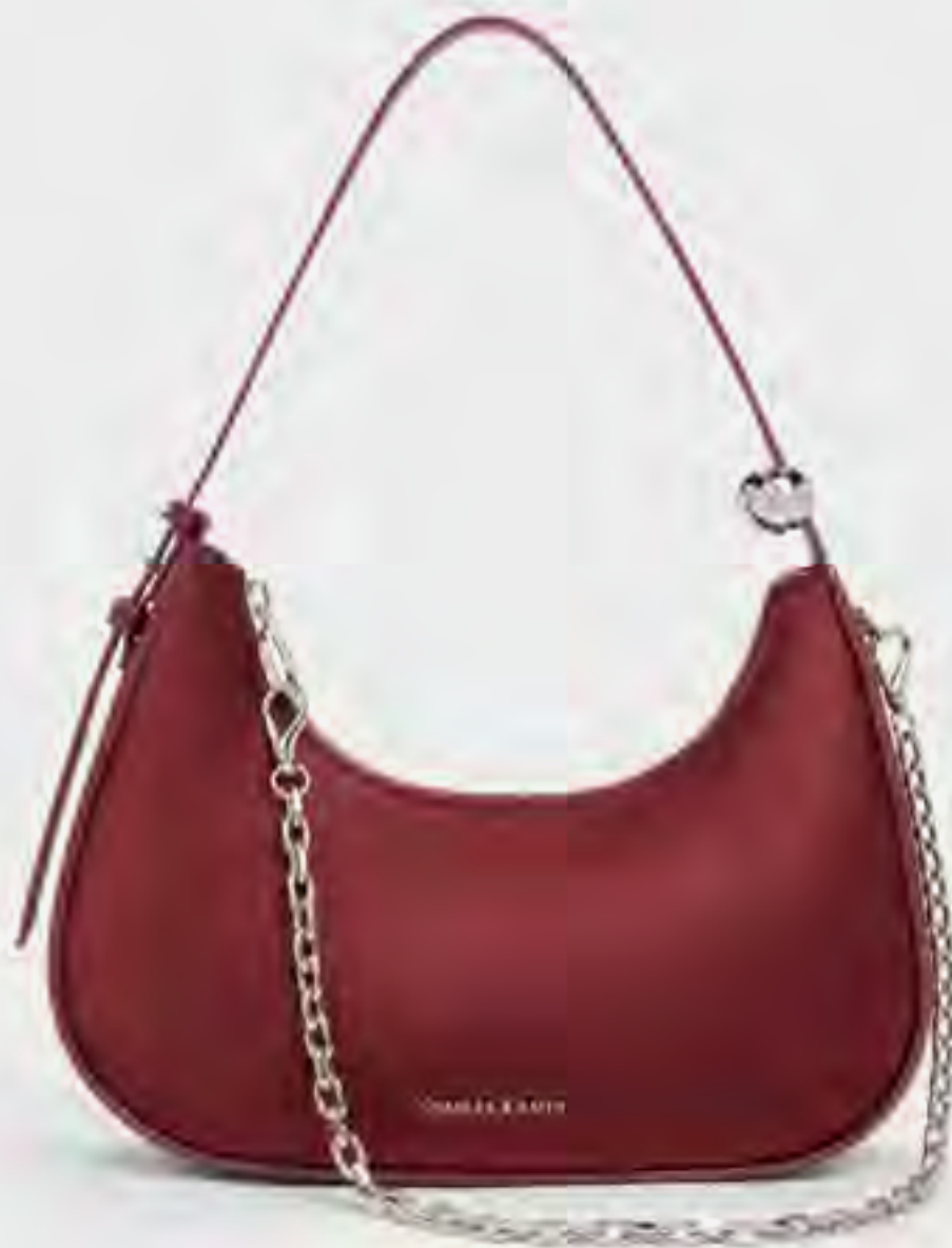
حقية جيسمين ساتان بسلسلة قابلة للطريقتين AED 450