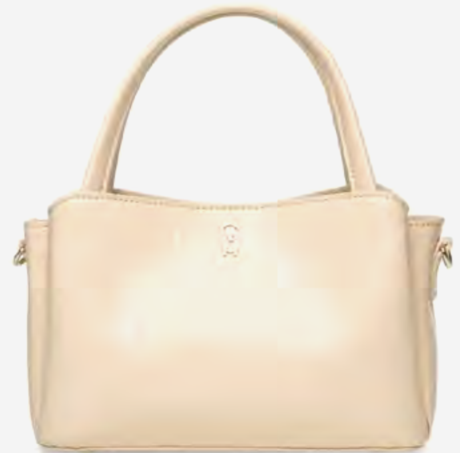
شنطة كتف بسفينكس بلمس نسيجي AED 399