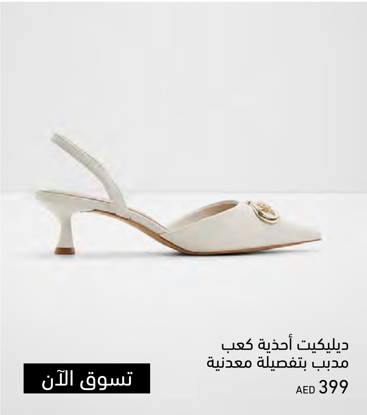
ديليكيت أحذية كعب مدبب بتفصيلة معدنية AED 399