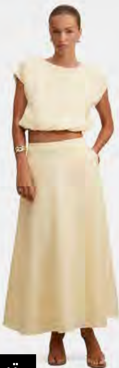
تنورة ماكسي جورجينا بتصميم غوديه AED 319