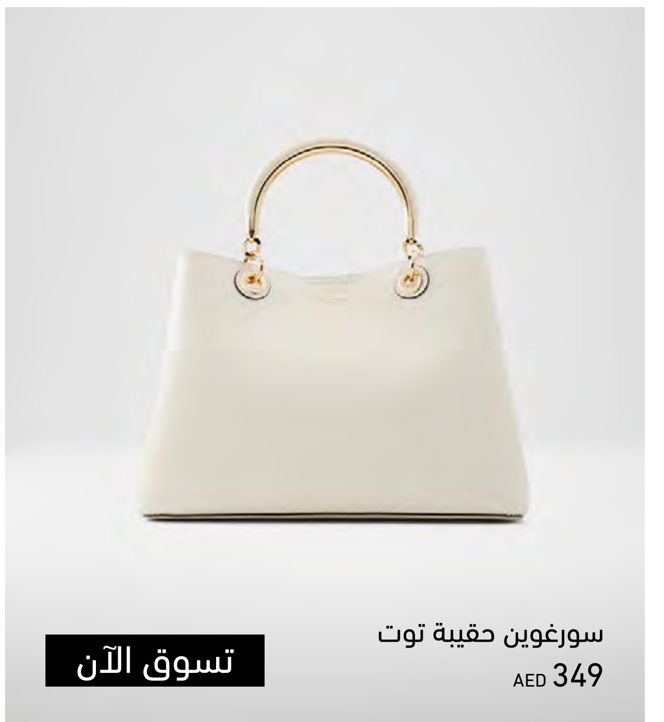
سورغوين حقيبة توت AED 349