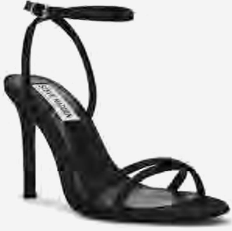
كعب جايبيسي بسيور كاحل مرصعة AED 399