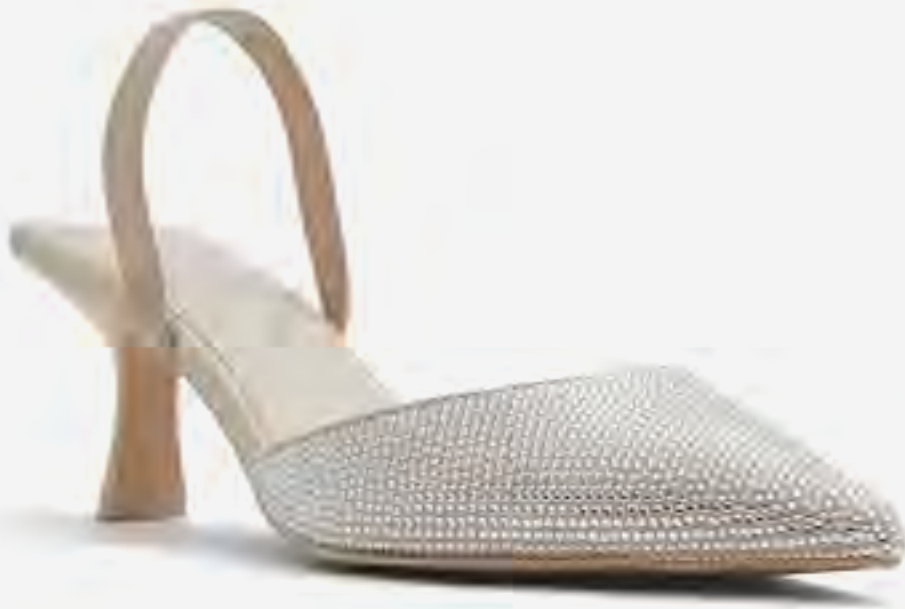
زيدان حذاء كعب كيتن أنيق AED 279