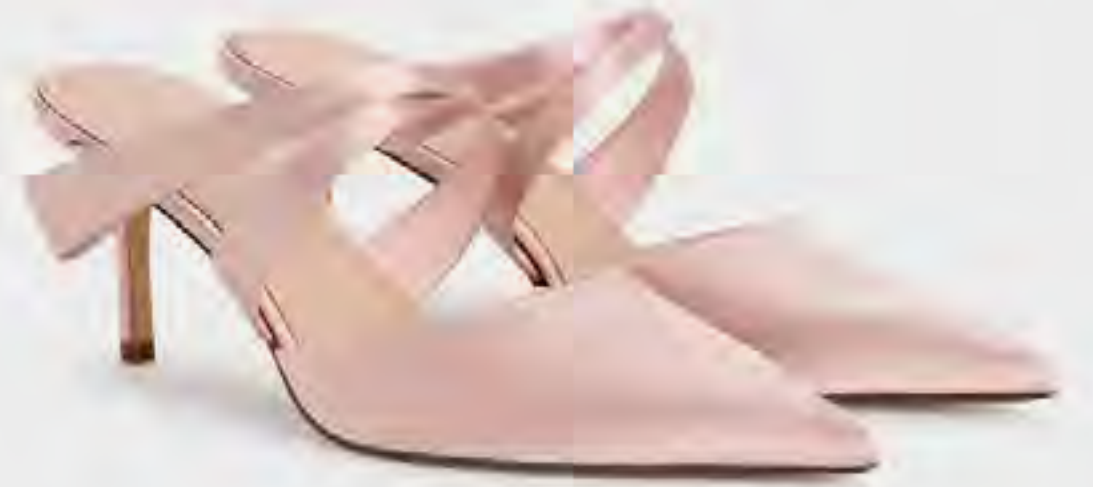
حذاء مول بكعب مع تفاصيل مطوية من الساتان AED 400