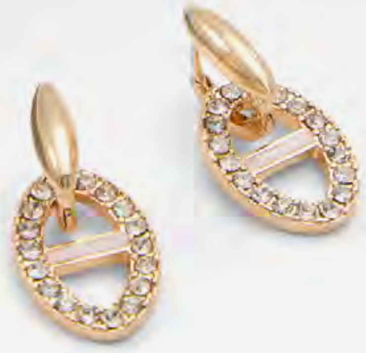
ريريانا أقراط حلق مرصعة