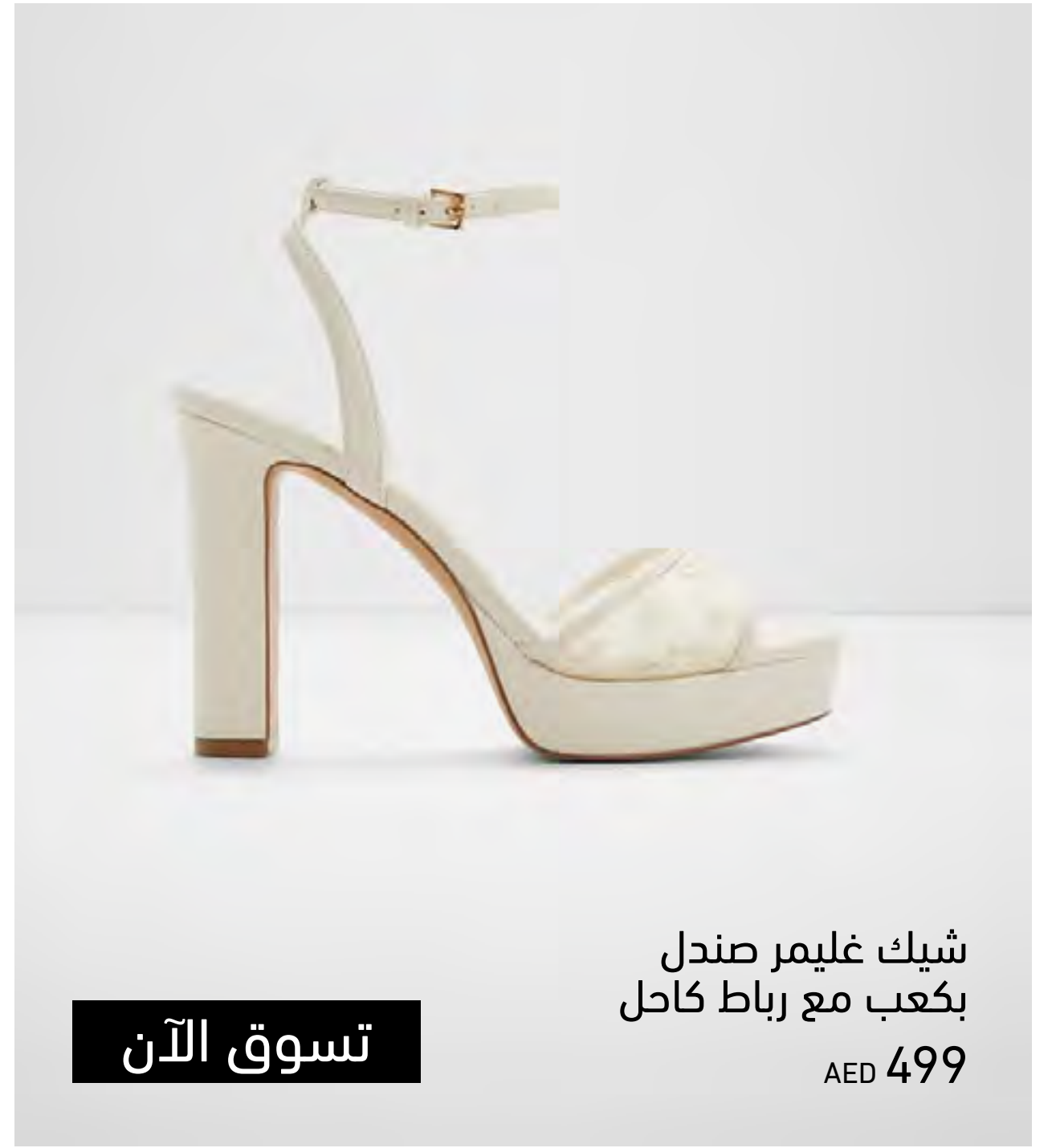
شيك غليمر صندل بكعب مع رباط كاحل AED 499