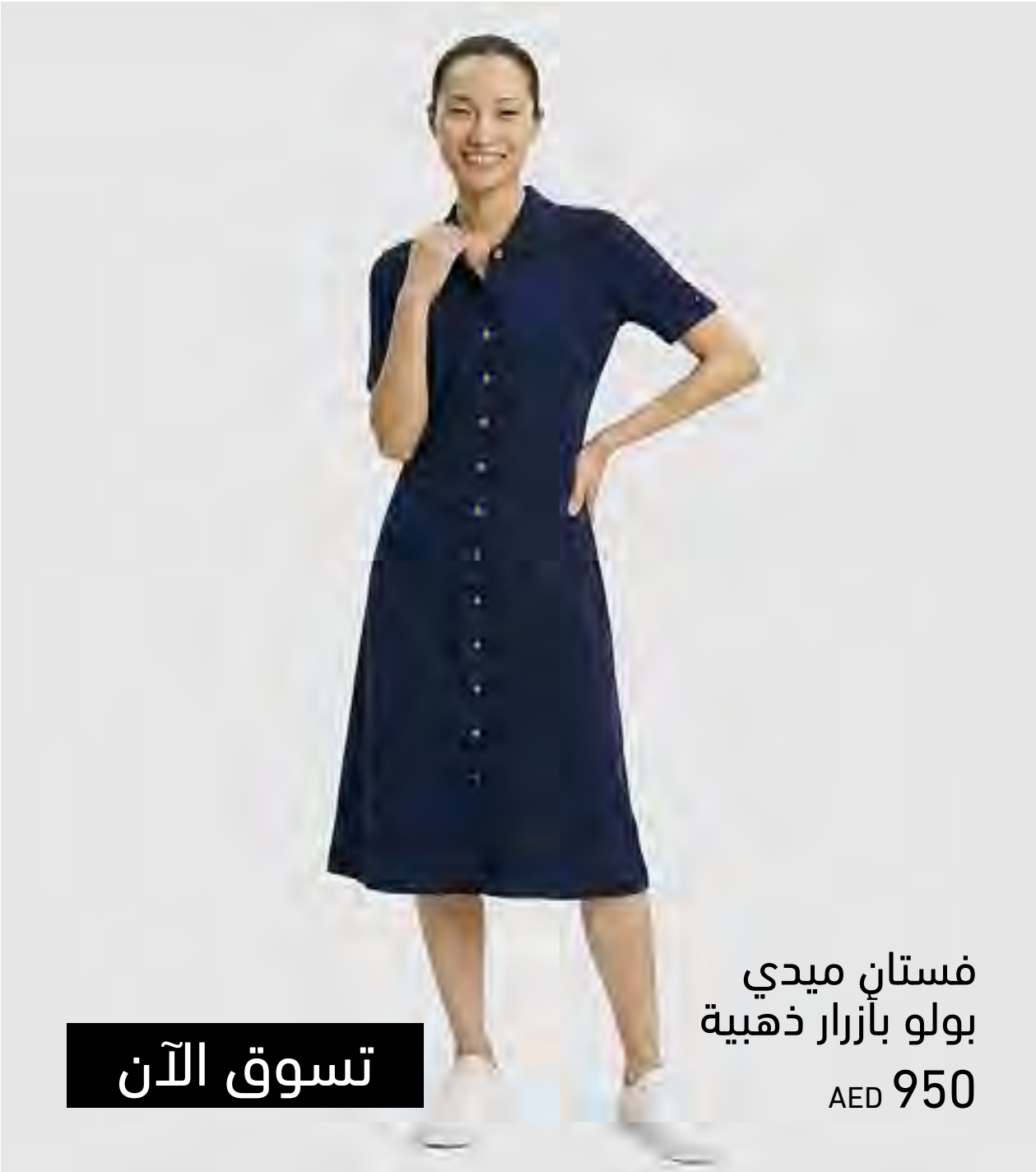
فستان ميدي بولو بأزرار ذهبية AED 950