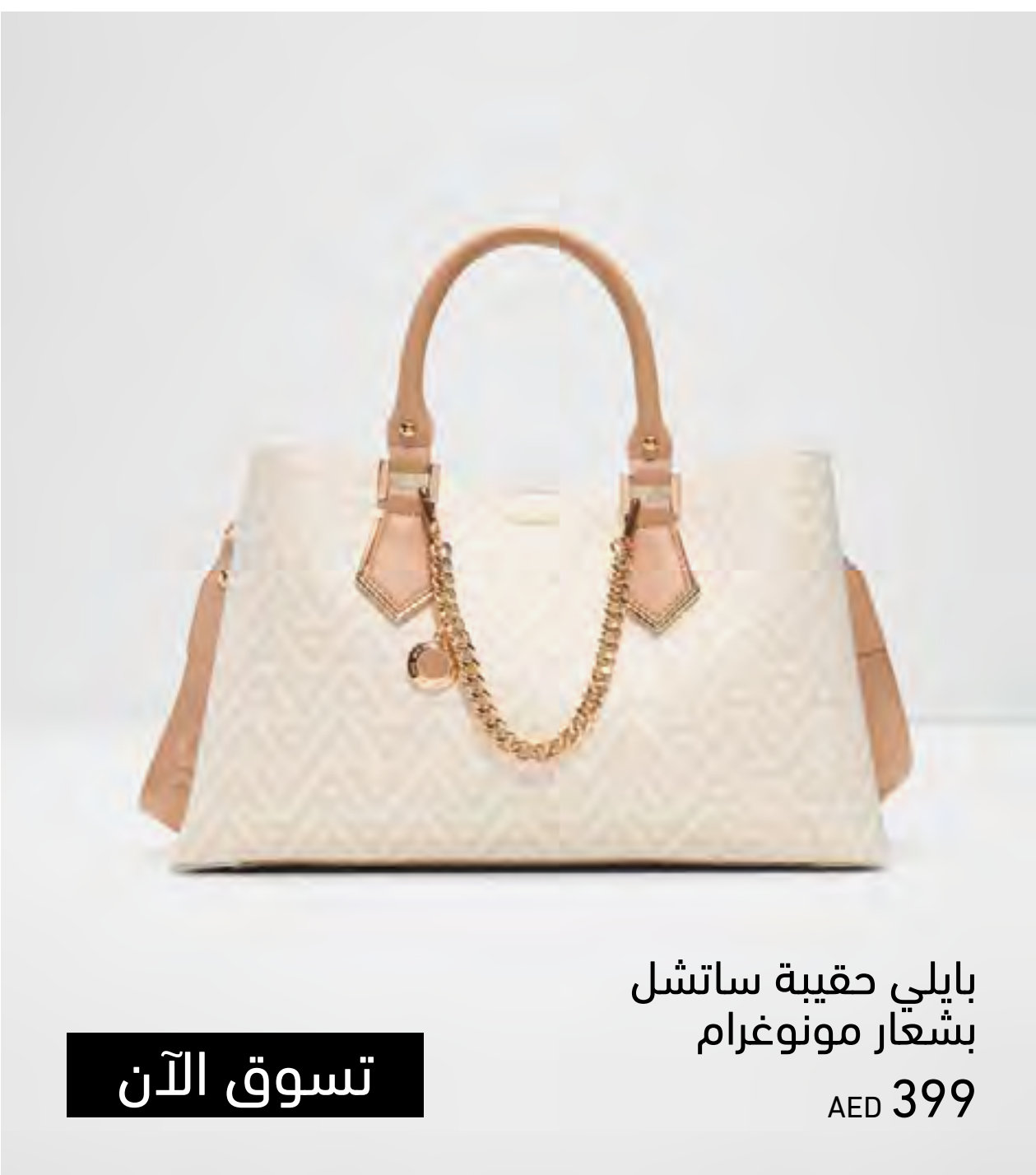
بايلي حقيبة ساتشل بشعار مونوغرام AED 399