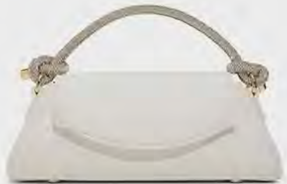
بيوثا حقيبة يد بمقبض علوي مرصعة AED 229