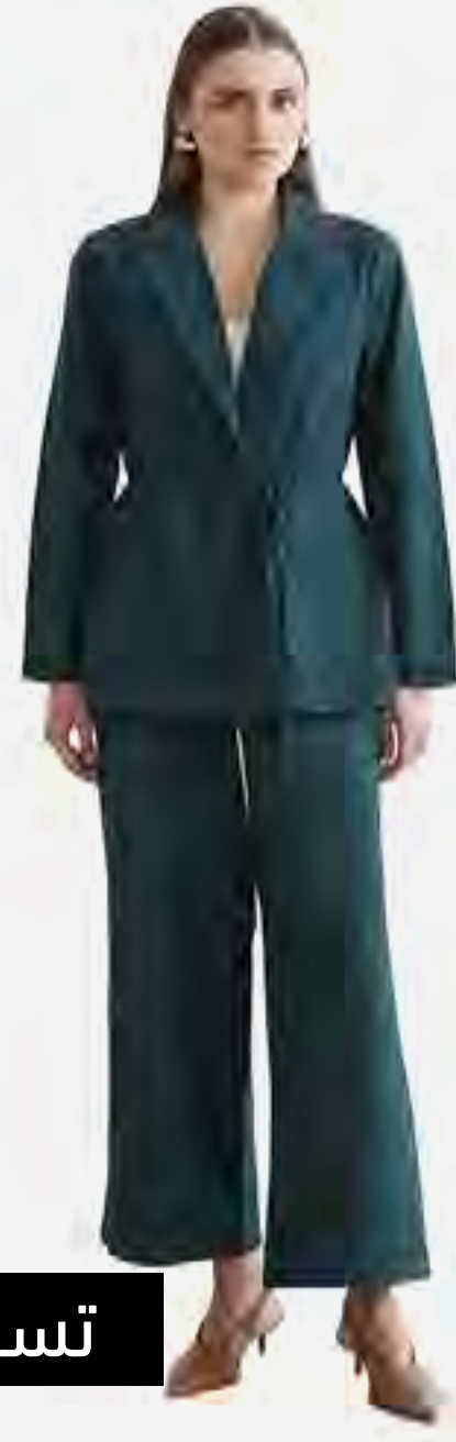
جاكيت سادة كم طويل بحزام AED 169