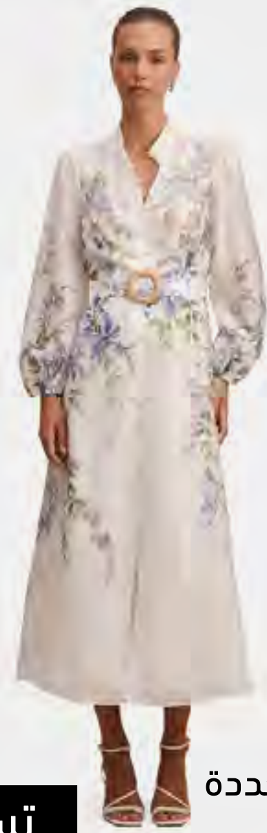
فستان ميدي شيريدان بطبعة محددة AED 659