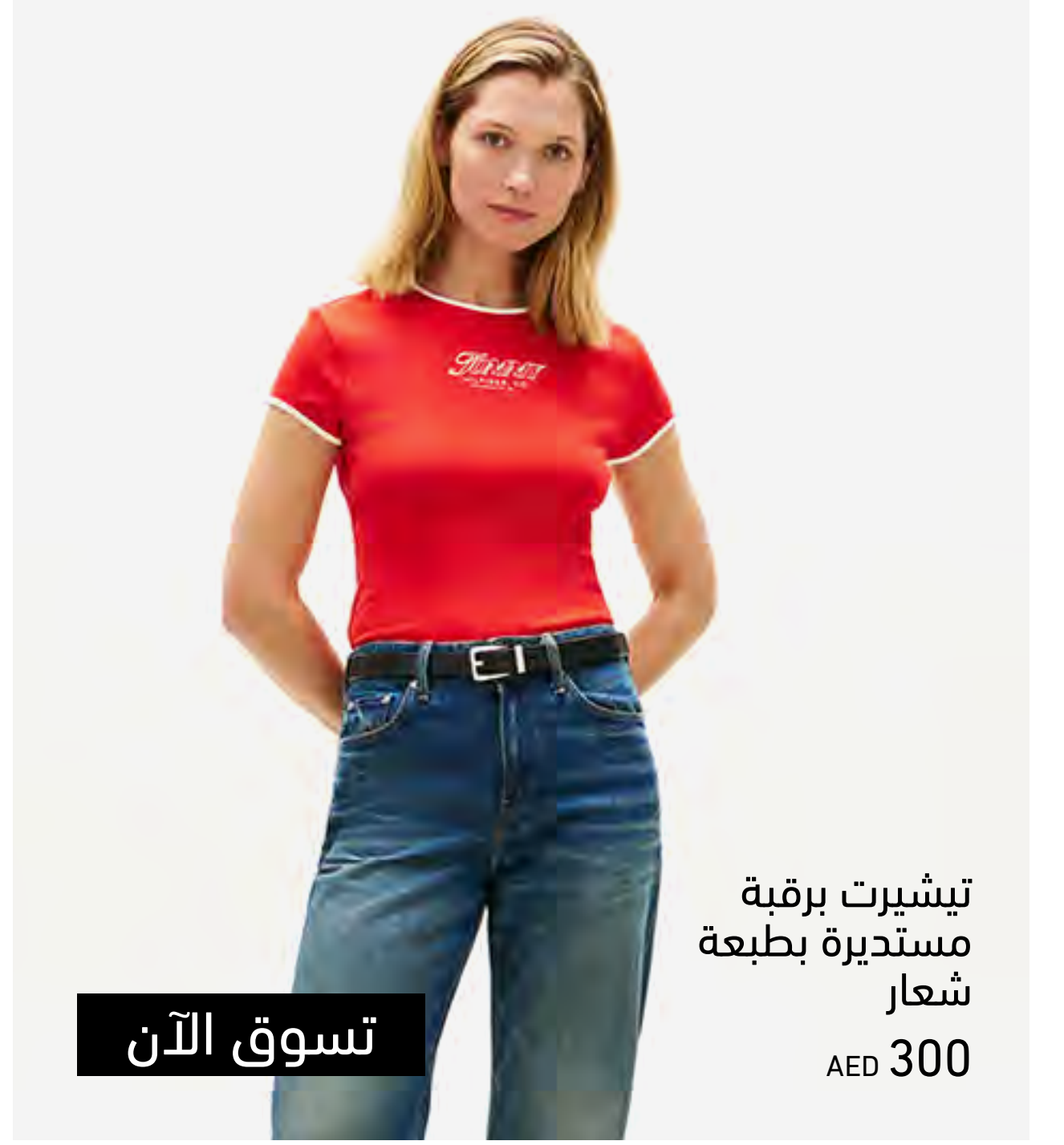
تيشيرت برقبة مستديرة بطبعة شعار AED 300