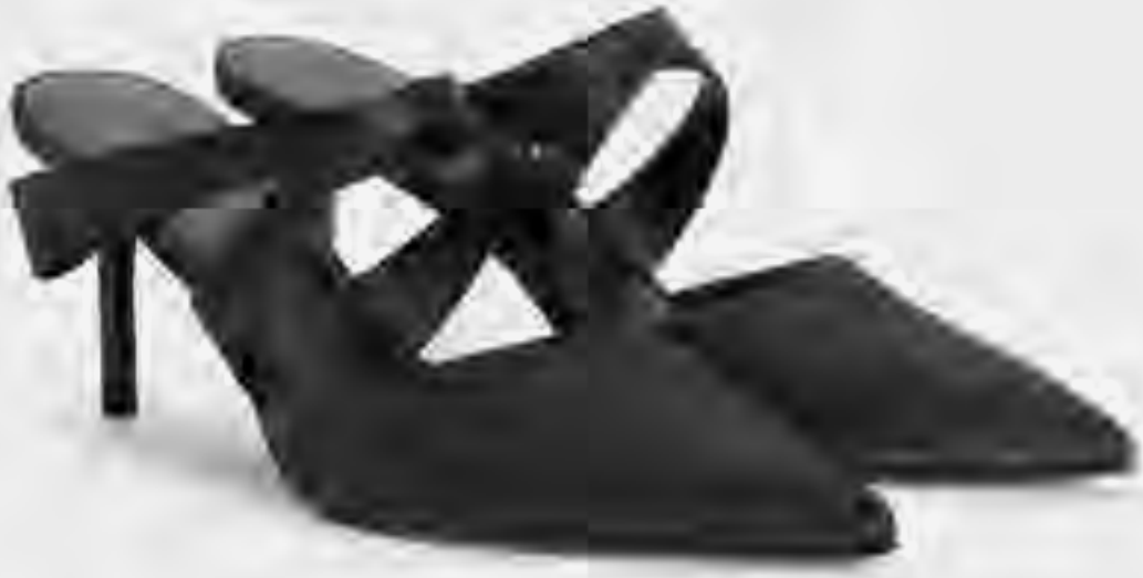
حذاء مول بكعب مع تفاصيل مطوية من الساتان AED 400