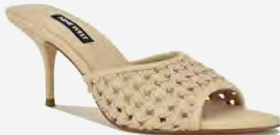
صندل كعب كيريللا 3 مفتوح من الأمام AED 379