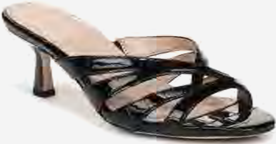
صندل كعب ناتيوزداي بمقدمة مفتوحة AED 549