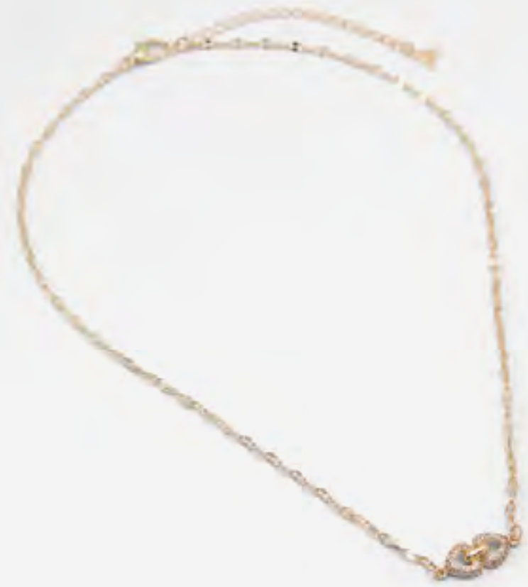
تينزيل عقد مزين بتفاصيل مرصعة