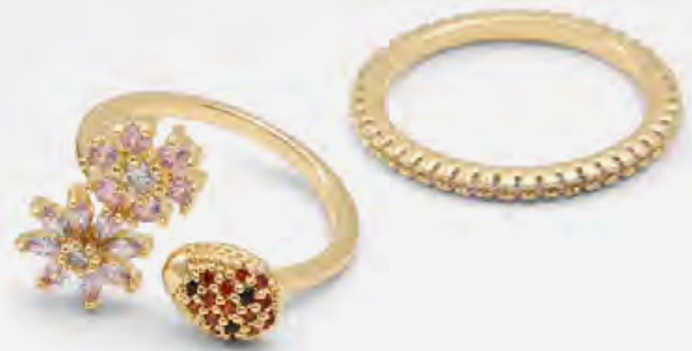
بيبلوسوم طقم خواتم مزينة