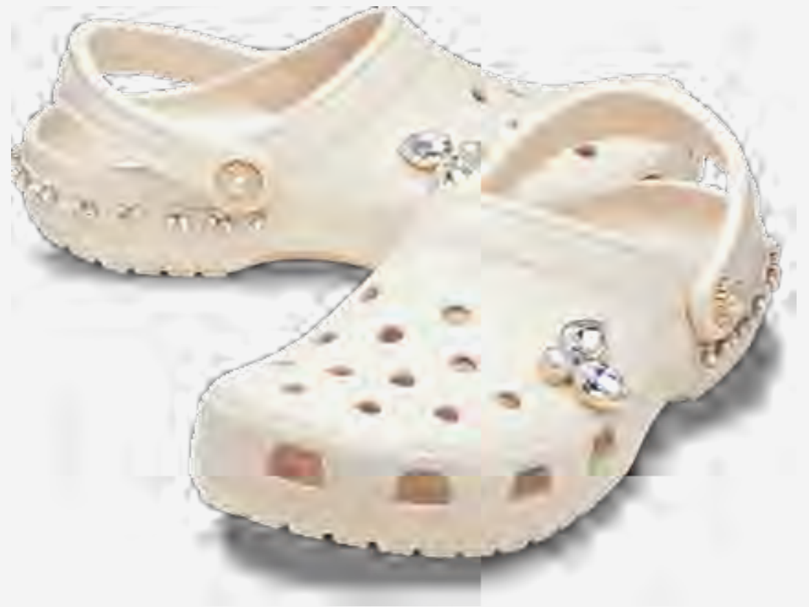
كلوغ كلاسيك بيناكل AED 349