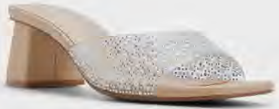
لانا صندل بكعب عريض مرصع AED 249