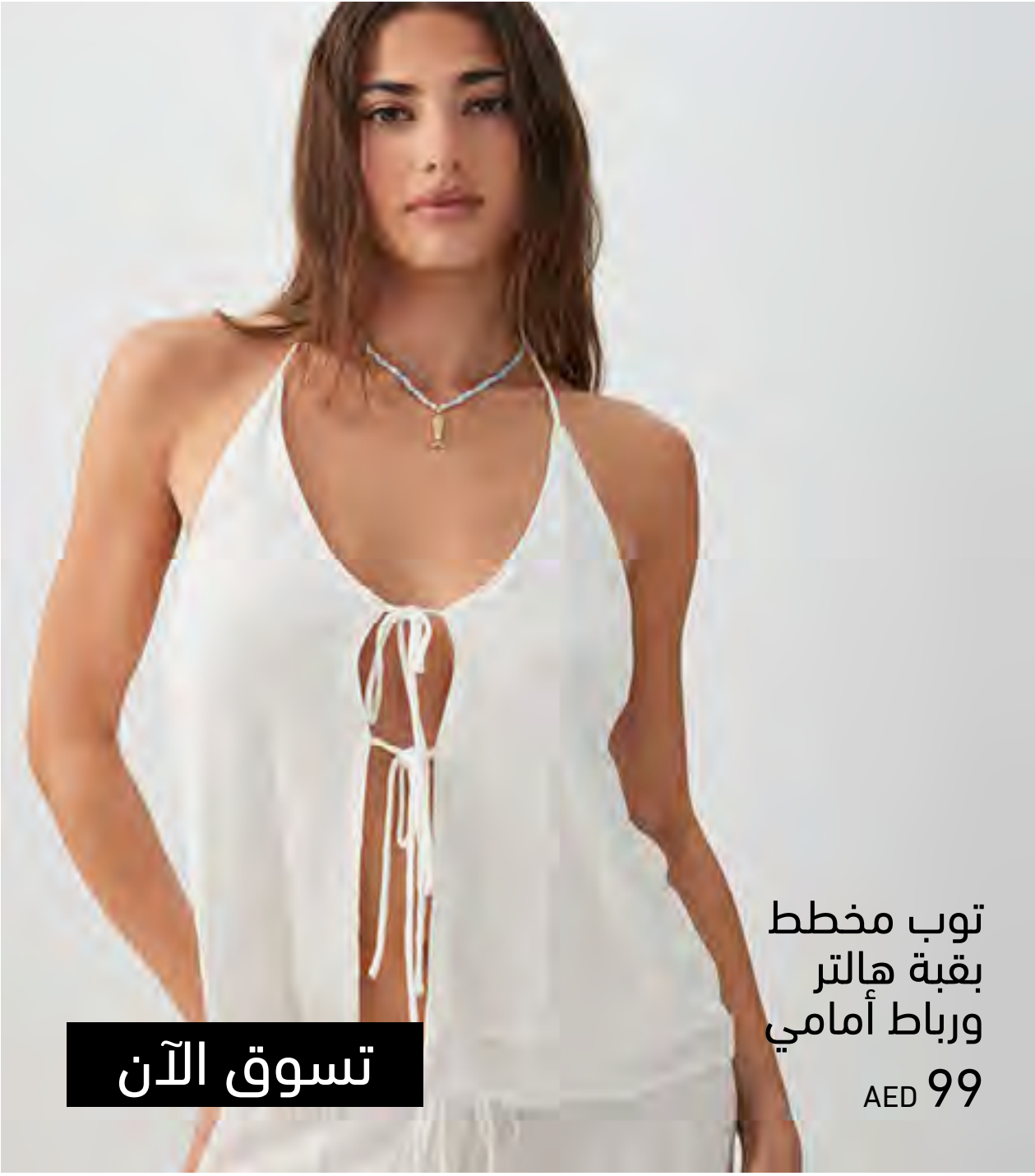
توب مخطط بقبة هالتر ورباط أمامي AED 99