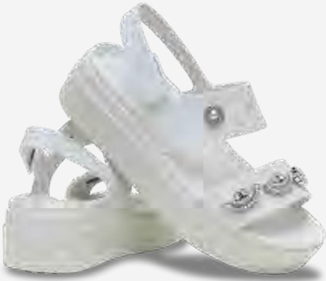
صندل بروكلين بيناكل مزين 4 يو AED 329