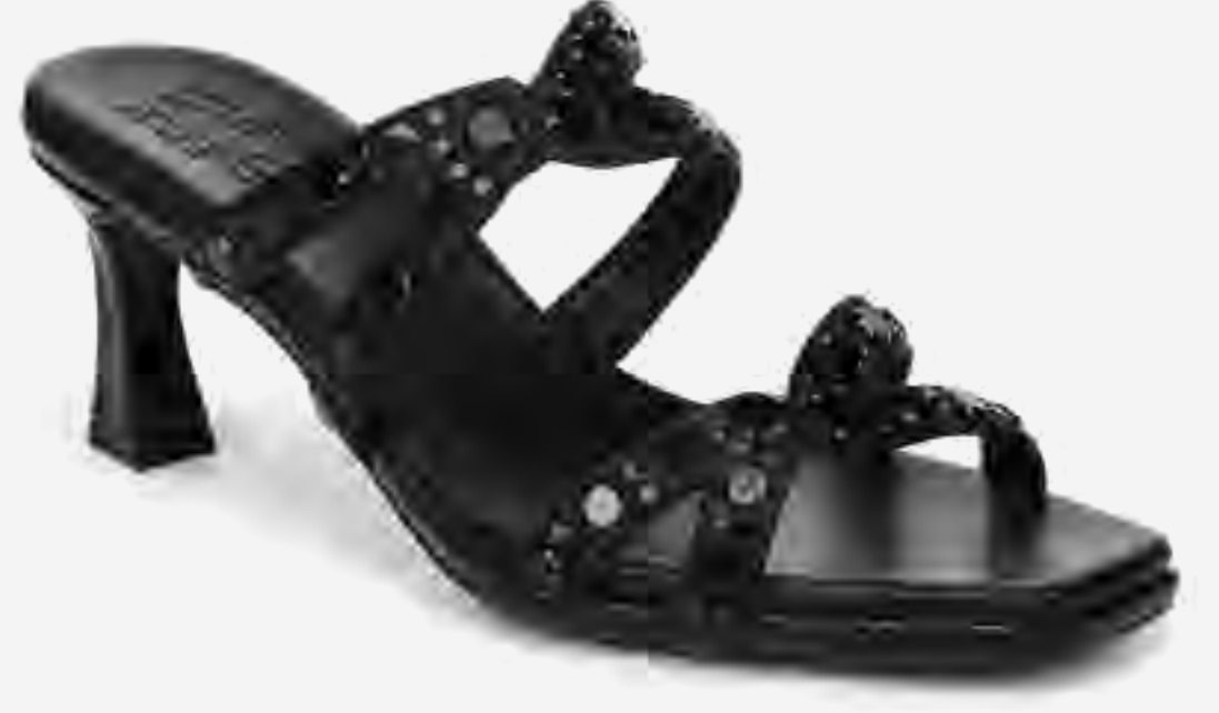
صندل كعب ناكيمي مفتوح ومزين AED 499