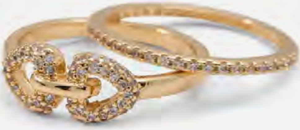
سيليت طقم خواتم مزينة (قطعتين)