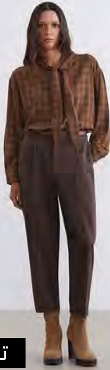
بنطلون رسمي منسوج سادة بخصر عالي AED 99