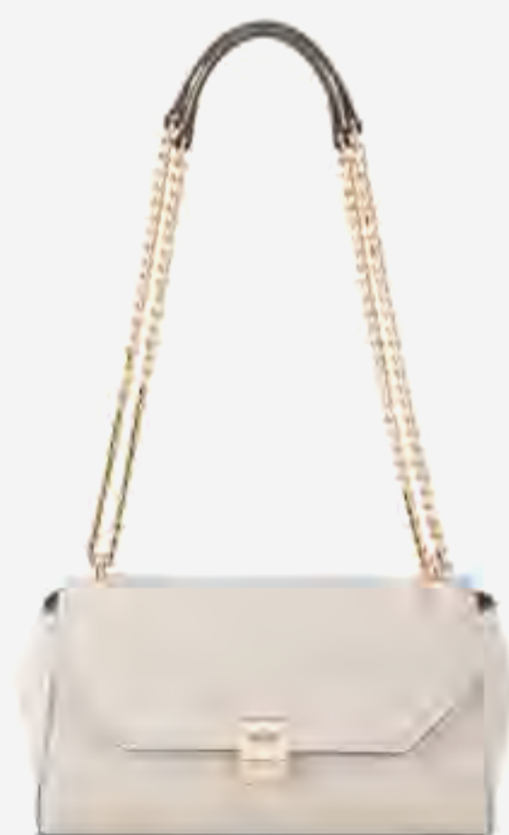
شنطة كتف بملمس نسيجي قابلة للتعديل AED 379