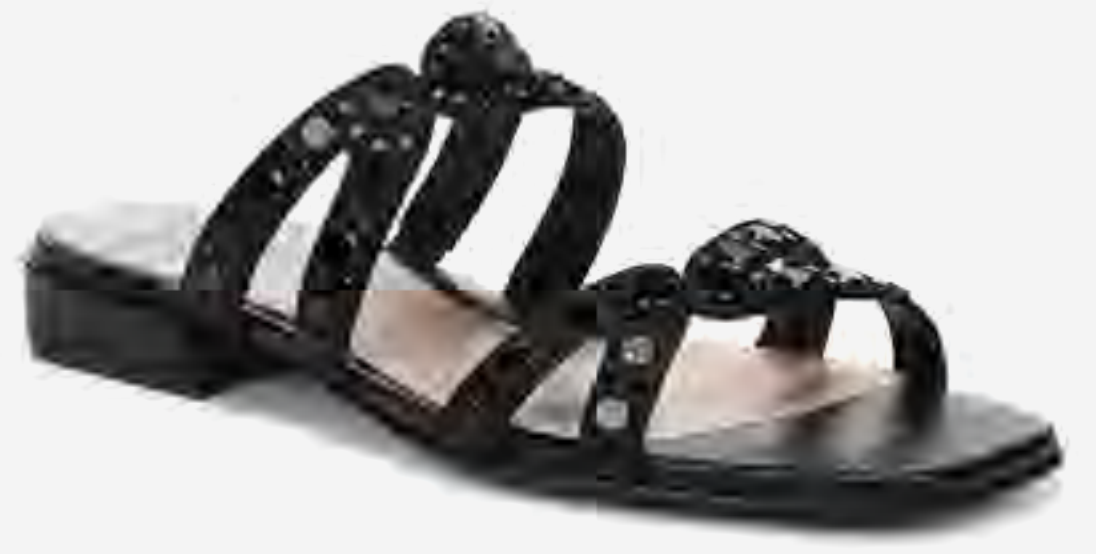
صندل بكعب قصير مزين AED 449