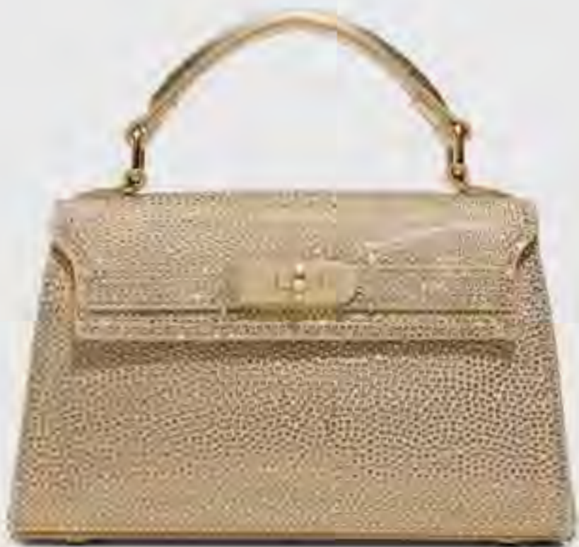
جوزي حقيبة يد بمقبض علوي مرصعة AED 279