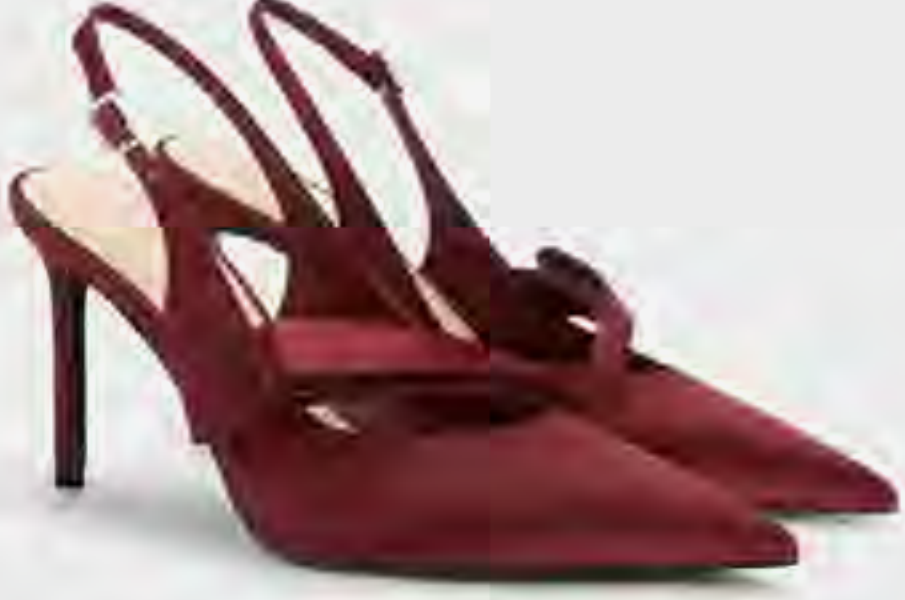
حذاء كعب ستيليتو بسير خلفي مطوي من الساتان AED 400