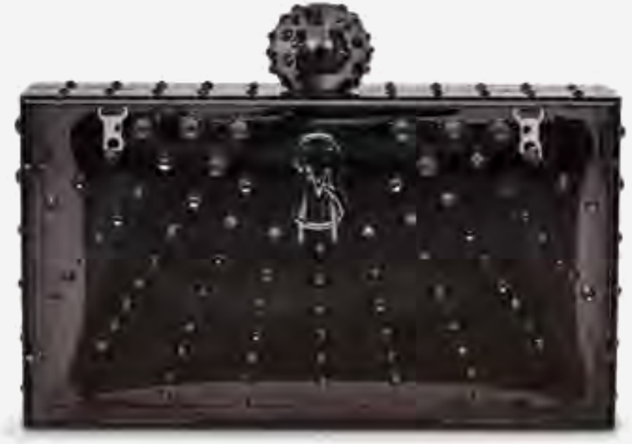
شنطة كلتش بانجلز بتفصيلة شعار AED 349