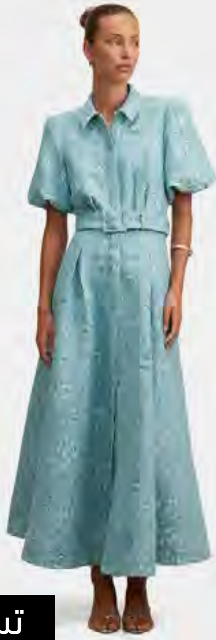
فستان قميص ماكسي جاكارد AED 759