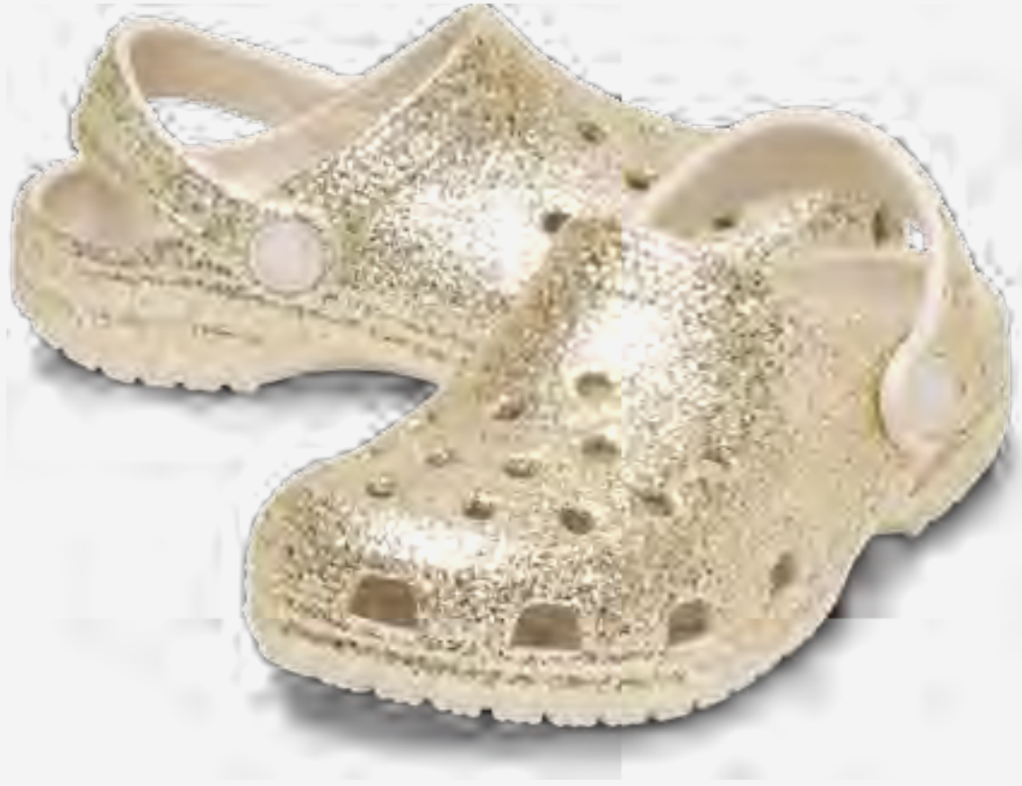
كلوغ تشانكي كلاسيكي لامع AED 279